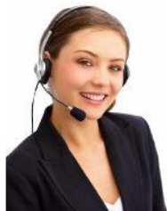
Servicio al Cliente: 593-098165817